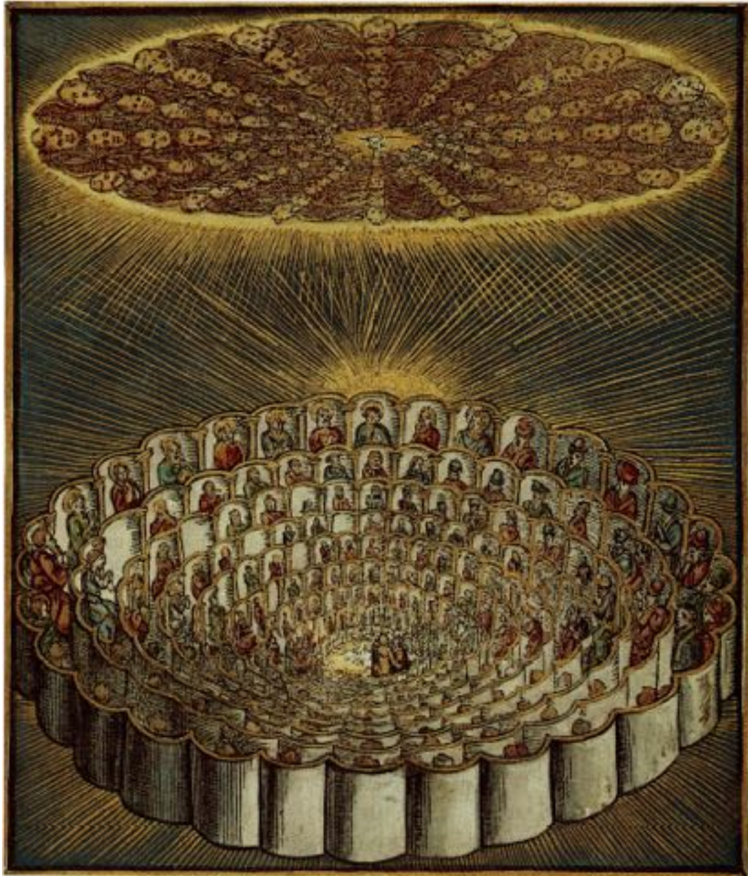
Apothéose de la Divine Comédie: arrivée et accueil de Dante et Béatrice au paradis dans le Collegium Sancti Spiritus surmonté par les Hiérarchies Célestes.

porte du temple ; la connaissance de soi est la porte de la libération. »