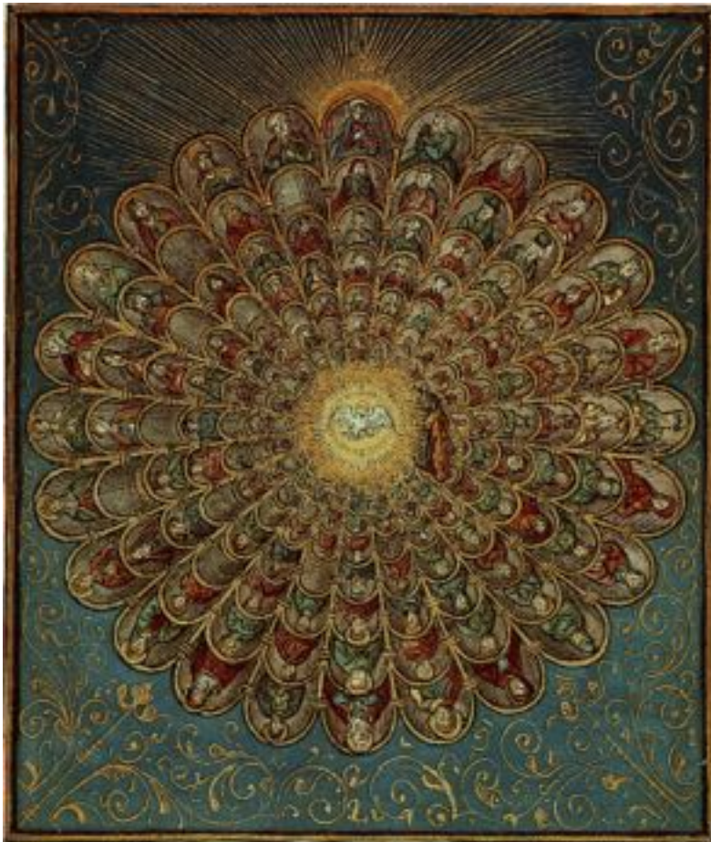
Le Collegium Sancti Spiritus.

Tout commence par un désir du salut profond et appelant, auquel la Gnose ne manque pas de répondre : quand l'élève fait un pas vers la vie libératrice, la force christique en fait deux à sa rencontre. Telle est la mesure infaillible du progrès sur le chemin.