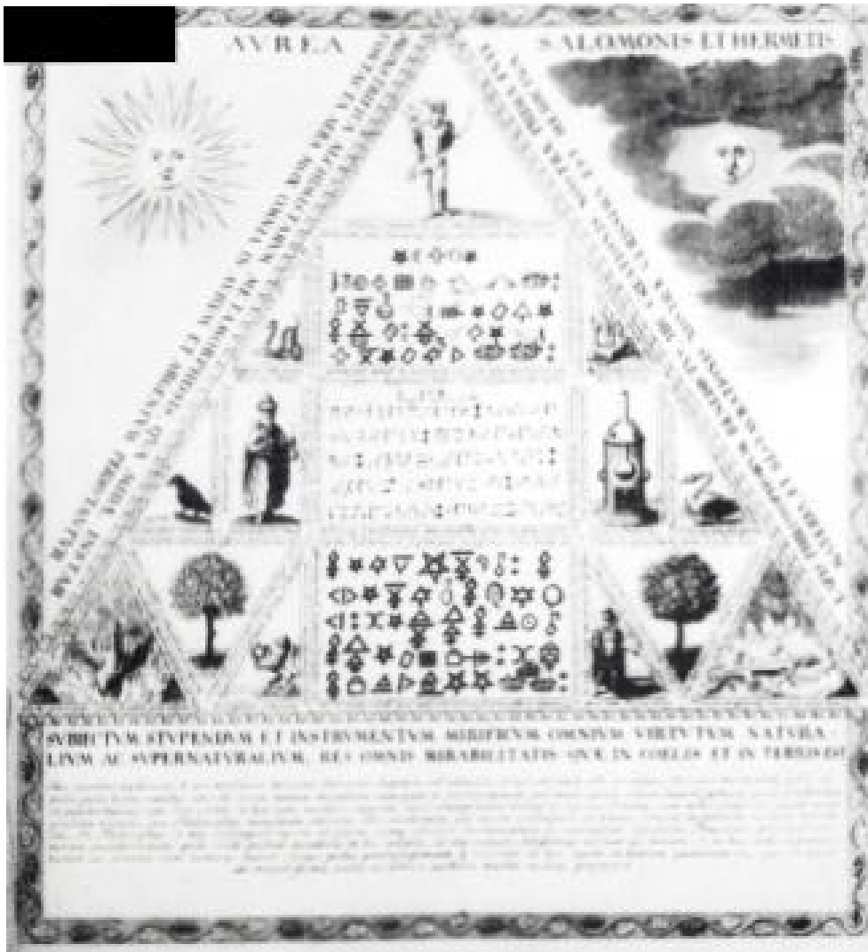
La Table d'or de Salomon et Hermès. Représentation alchimique.

Nous comprenons ainsi, de façon nouvelle et concrète, le verset 18 du 3ème chapitre de l'Apocalypse de Jean : « Je te conseille d'acheter de moi de l'or purifié par le feu, afin que tu deviennes riche ».