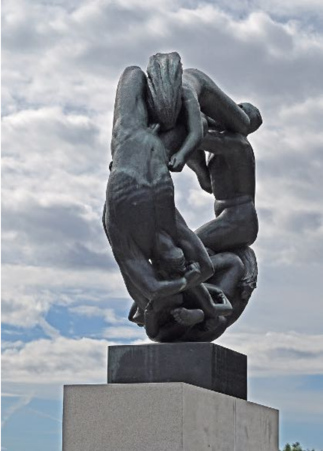
Parc Vigeland à Oslo.