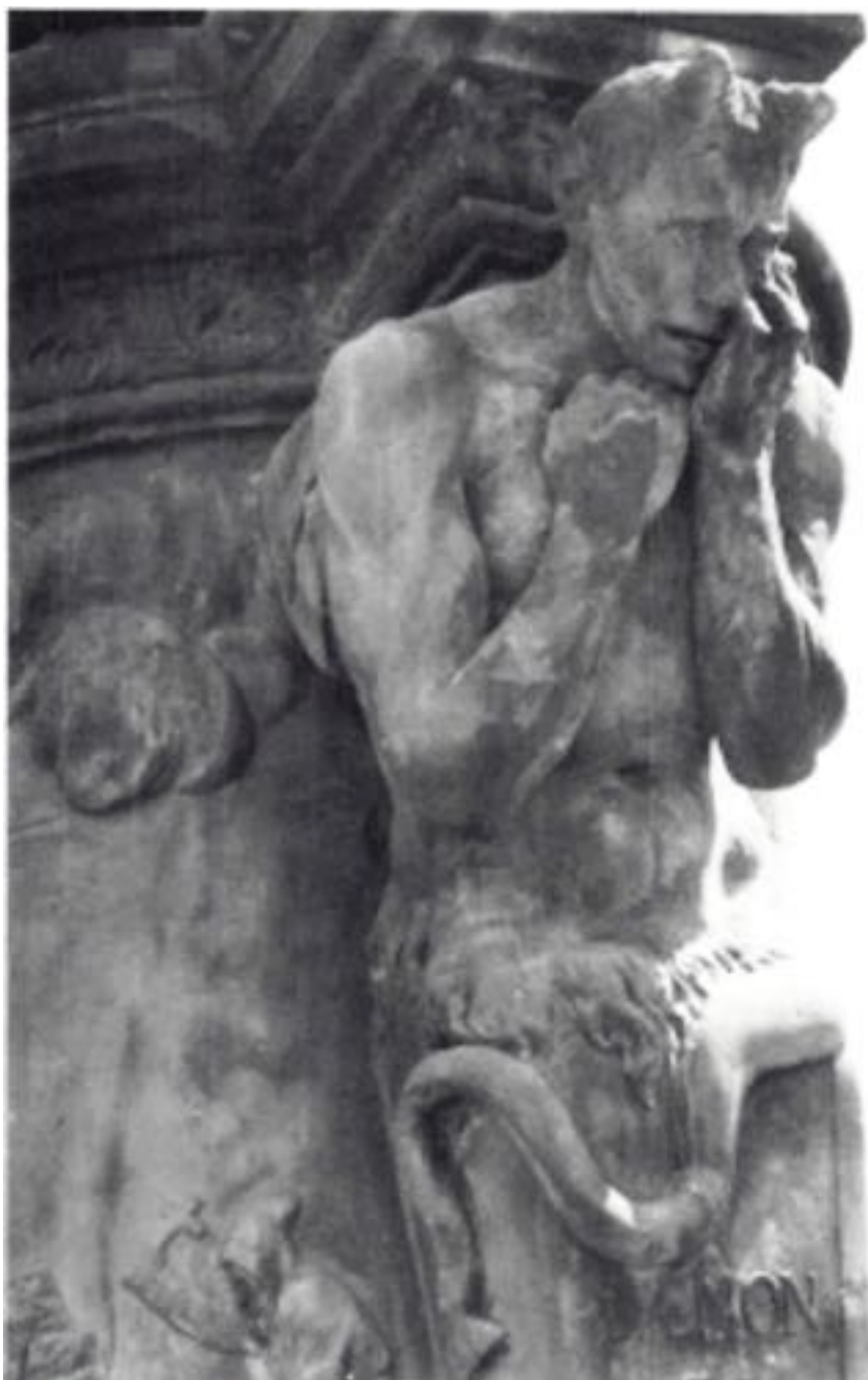
Le démon qui pleure. (Grès sur le Pont Charles, Prague, Tchécoslovaquie)