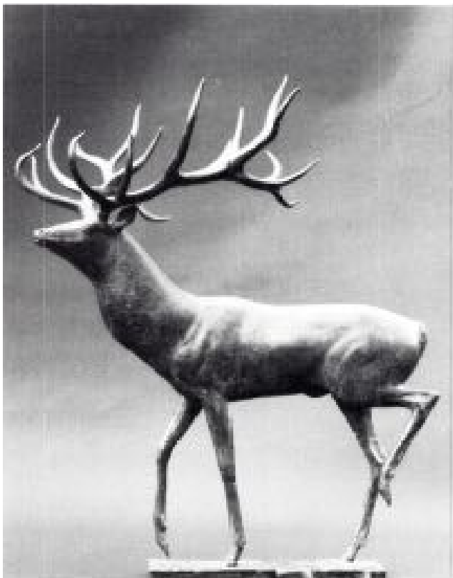
Cerf primitif en bronze.

Ce chemin de croix, irradié par la lumière du soleil divin, est souvent représenté par la croix druidique, comportant un cercle autour de son centre, et que l'on rencontre partout en Europe. Les hautes croix irlandaises sont souvent plantées sur d'antiques sanctuaires, comme c'est aussi le cas des pierres érigées comme monuments funéraires par les Bogomiles. Ils montrent le plus souvent des reliefs compliqués, aux détails tirés de la chasse aux cerfs. Parfois le cerf se tient au centre de la croix.