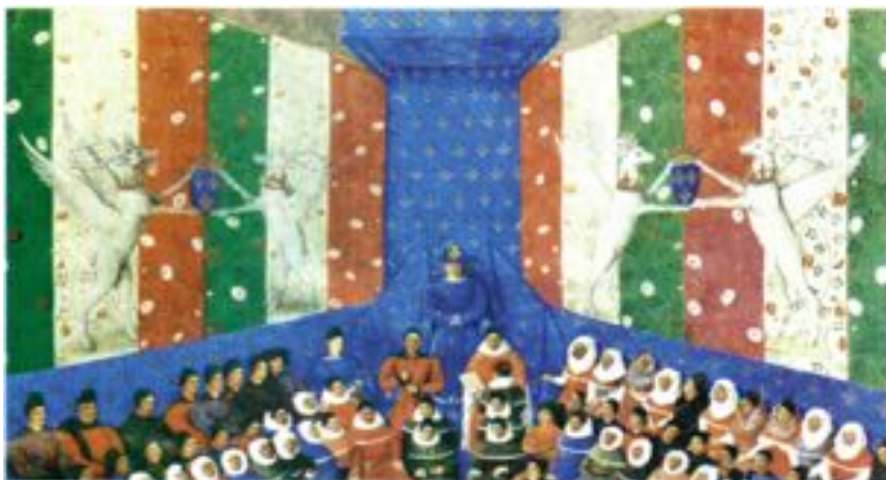
Cerfs ailés portant couronne d'or. Peinture murale de la salle d'audience où se tint le procès du Duc d'Alençon. (Jean Fouquet, 15ème siècle.

Comme une biche soupire après des courants d'eau, Ainsi mon âme soupire après toi, ô Dieu ! Mon âme a soif de Dieu, du Dieu vivant : Quand irai-je et paraîtrai-je devant la face de Dieu ? (Psaume 42, 2-3)