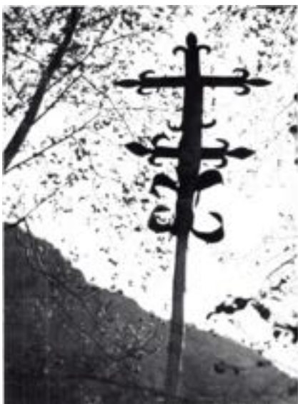
Croix cathare de Bouan, Sud de la France.

Vois donc qu'il faut mettre toute ton ardeur à être bon ; non pas tant dans tes actes et dans tes œuvres, mais dans les raisons profondes de ce que tu fais. »