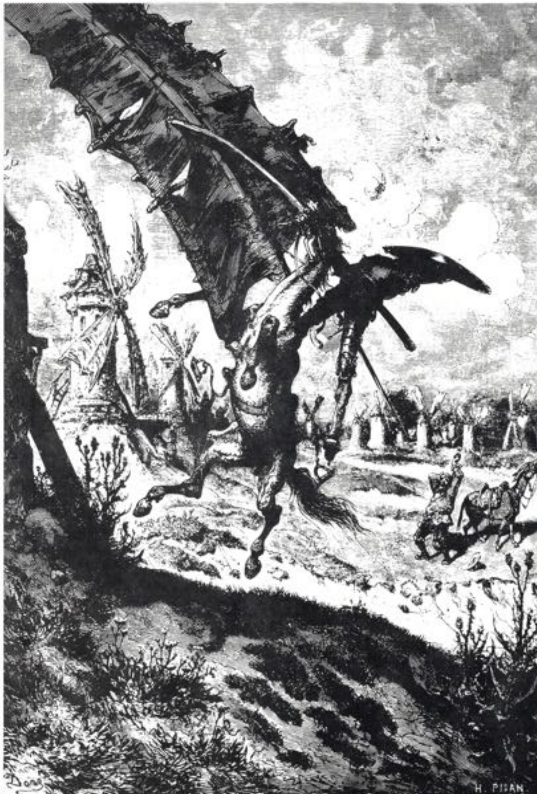
Don Quichotte dans sa lutte désespérée contre l'illusion (Gravure de Gustave Doré)