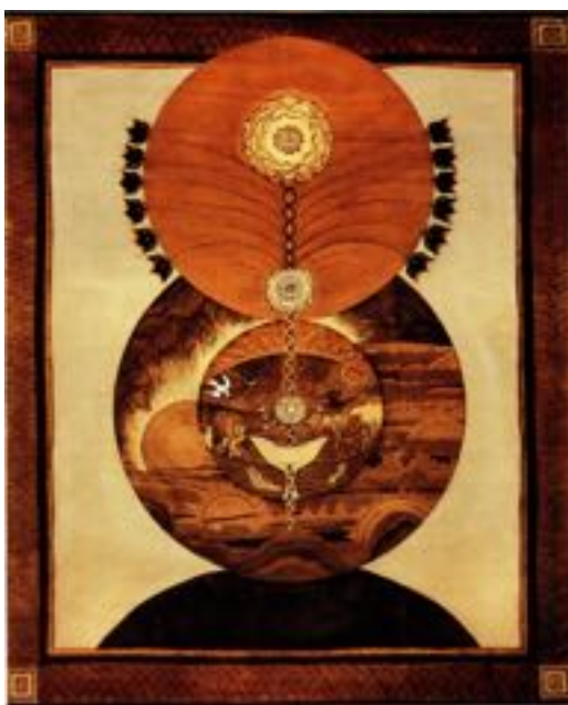
Pyrogravure : Le Graal et la Rose (H. Coutin)

Une telle façon d'agir est depuis toujours considérée comme une folie; Perceval aussi part à la recherche du Graal comme un fou. L'endoura souligne l'anéantissement de la partie impie du microcosme-la partie où siège le moi.