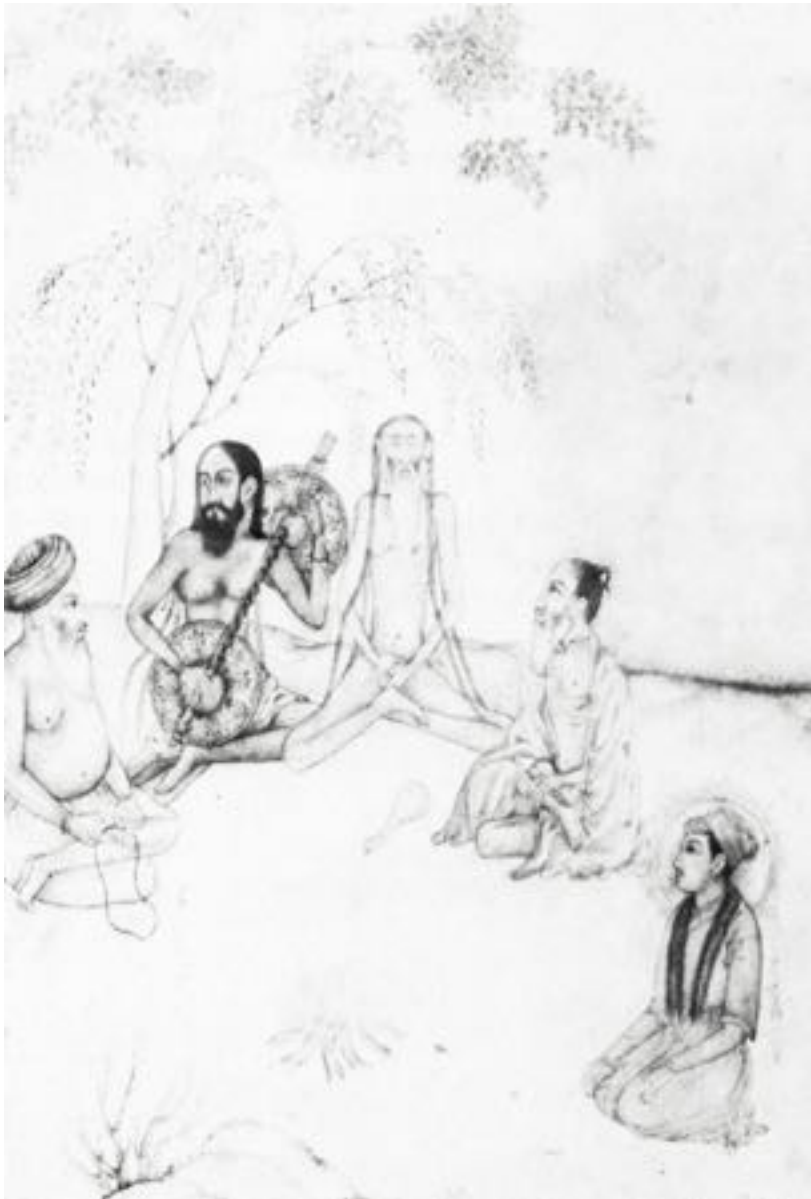
Yogi faisant usage de la musique méditative dont s'inspire actuellement la musique du « Nouvel Age » 1635

Pourquoi un effet si suggestif émane-t-il de ces répétitions de vagues de sons rythmiques, et pourquoi sont-elles tant utilisées dans la musique New-Age ?