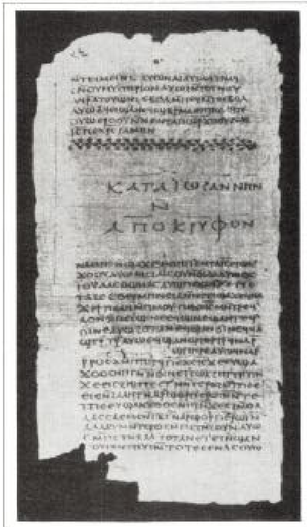
Extrait d'un codex de Nag Hammadi.

« Embrassons-nous avec amour, Ô mon fils.