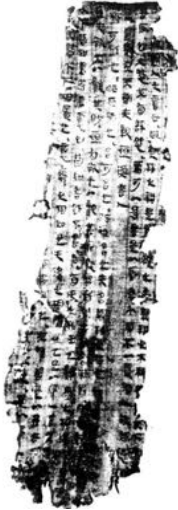
Fragment d'un manuscrit sur soie d'un écrit chinois du Tao Te King.

Il n'en reste pas moins que nous sommes encore plongés dans la vie quotidienne. Nous rencontrons partout le processus de nivellement et d'auto-destruction provoqué par le mauvais emploi de la Parole. A tous les niveaux de notre société, dans l'économie, la science, l'éducation, l'art et la religion, dans les mass-médias et surtout dans le langage courant journalier, on remarque clairement combien le processus d'effritement est déjà avancé. Affaiblis, mutilés, creux ou gonflés, enthousiastes ou désespérés, les mots se bousculent et valsent entre les hommes qui se les renvoient, accélérant le déclin ; de façon toujours plus obstinée et plus dangereuse, ils se servent des vingt-quatre pierres de construction cosmiques pour créer encore une fois, par leur magie, une imitation