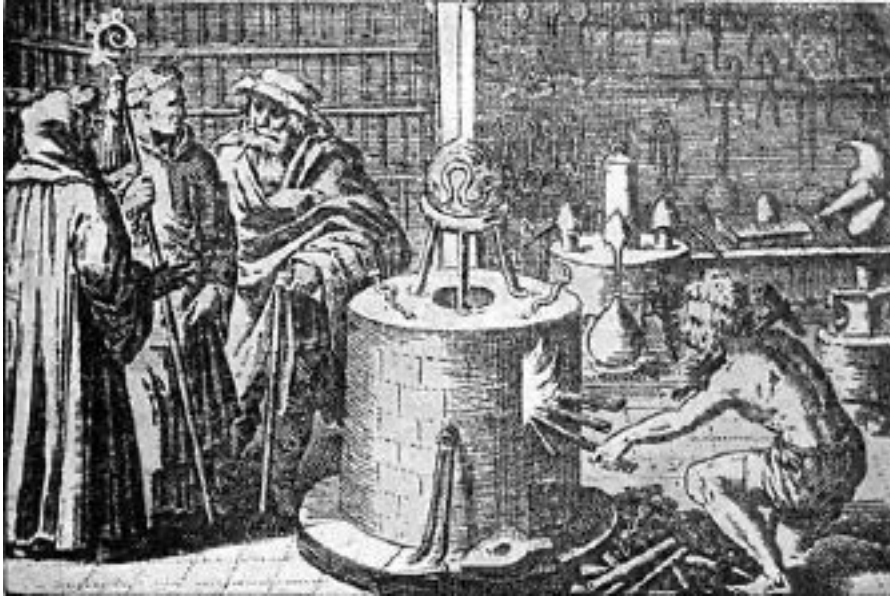
« L'Aichimiste » (Michael Maier, Tripus Aureus )

Et voici maintenant comment se déroule l'opération. Tout d'abord, il faut confier le Soufre au Feu, puis on y incorpore lentement le Mercure et le Sel, et le produit final est l'Or. La Flamme doit être allumée par le Feu. La Nature alors changera et, de la Mère, l'Or sera réalisé. Il faut enflammer l'Esprit par le Feu, l'Eau alors bouillira et le Sang, qui doit cuire avec l'Eau, abandonnera l'Or au fond de la cornue.