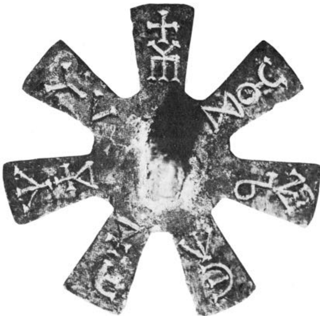
Médaille en bronze à sept branches portant des inscriptions de la période pré-bulgare

Nous avons créé autour de nous un champ pranaïque propre dont nous devons exister. La liaison entre nous et le domaine pranaïque originel est alors brisée. Il en résulte une grande détresse d'existence, et une chute toujours plus profonde.