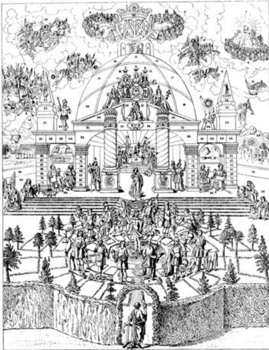
La « table d'études » cabalistique de la princesse Antonia De Wurtemberg * Page 26-27-28