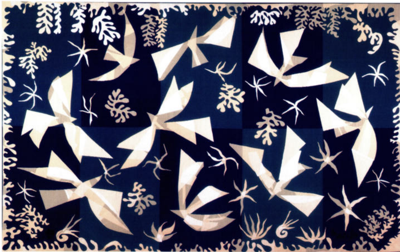
Matisse. Polynésie le Ciel , 1954

Alors qu'une fois né, l'animation de l'homme se tourne vers l'extérieur : il « exprime » son être, c'est l'inverse dans l'embryon qui, dans un certain sens, « imprime » son être. Ainsi grandit la forme. C'est au cours de la cinquième semaine environ que commence la formation des glandes génitales, qui, au commencement, sont identiques. Ce n'est qu'à la huitième semaine, sous l'influence de l'hormone masculine appelée testostérone que les organes génitaux se développent vers l'extérieur, déterminant l'apparition des caractéristiques masculines. Si cette influence hormonale ne se produit pas, ce sont les organes génitaux internes qui se développent.