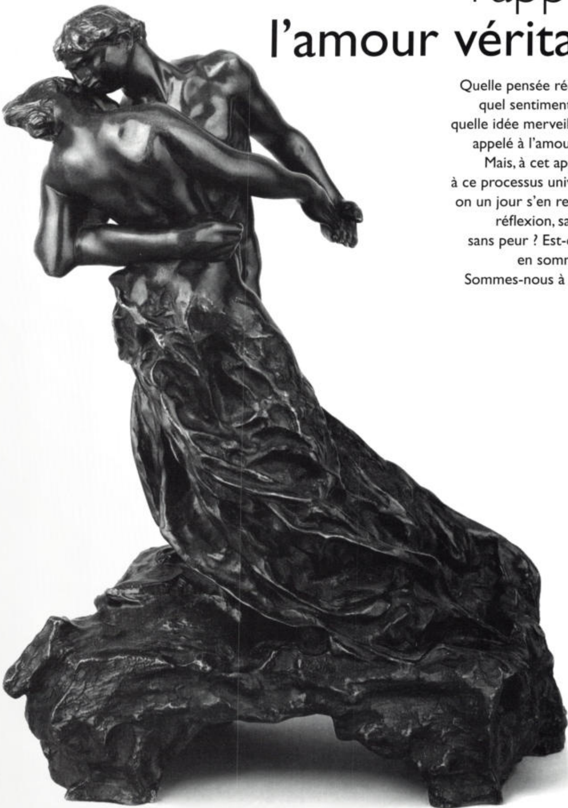
Camille Claudel, La Valse , 1905

Mais, à cet appel puissant, à ce processus universel, peut- on un jour s'en remettre sans réflexion, sans doute et sans peur ? Est-ce que nous en sommes dignes ? Sommes-nous à la hauteur ?