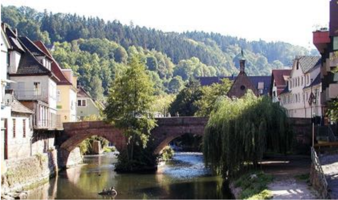
Partie ancienne de la ville de Calw