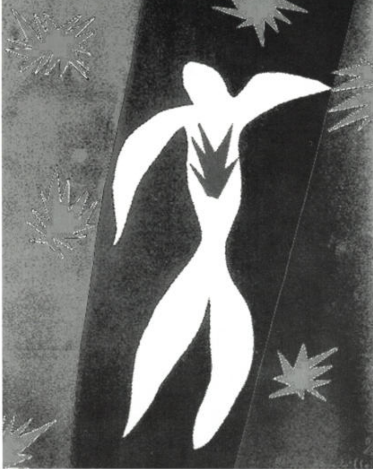
Nous sommes poussière – poussière d'étoiles