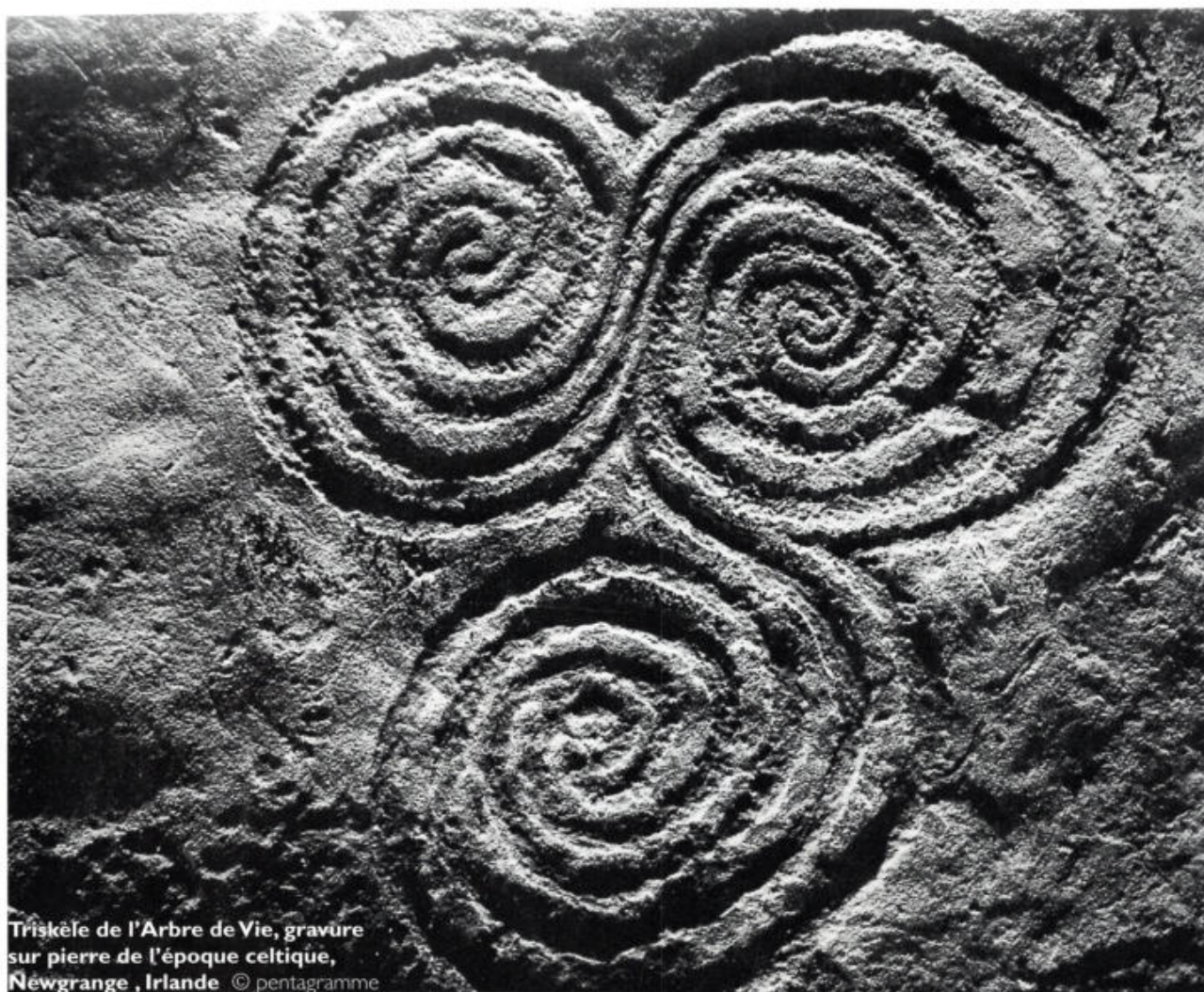
Triskèle de l'Arbre de Vie, gravure sur pierre de l'époque celtique, Newgrange, Irlande

de nouveau, il se relie à un être venant au monde. Ces deux domaines, visibles et invisibles, forment ensemble le monde comme nous le connaissons, c'est-à-dire bipolaire, où tout se manifeste en paires d'opposés: bien et mal, noir et blanc, beau et laid, maladie et santé, vie et mort, tangible et intangible. Il est à noter en outre, le caractère transitoire de toute chose. Ce monde est ainsi souvent qualifié de «dialectique».