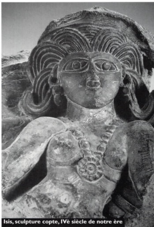
Isis, sculpture copte, IV e siècle de notre ère

S'il y a une chose dont le monde a besoin au début de l'ère nouvelle, c'est bien d'hommes et de femmes témoignant d'une véritable vie spirituelle, autrement dit d'une vie animée par l'esprit, attitude qui se manifeste parfois d'une manière subtile dans la façon de résoudre les problèmes ou de parler et d'agir.