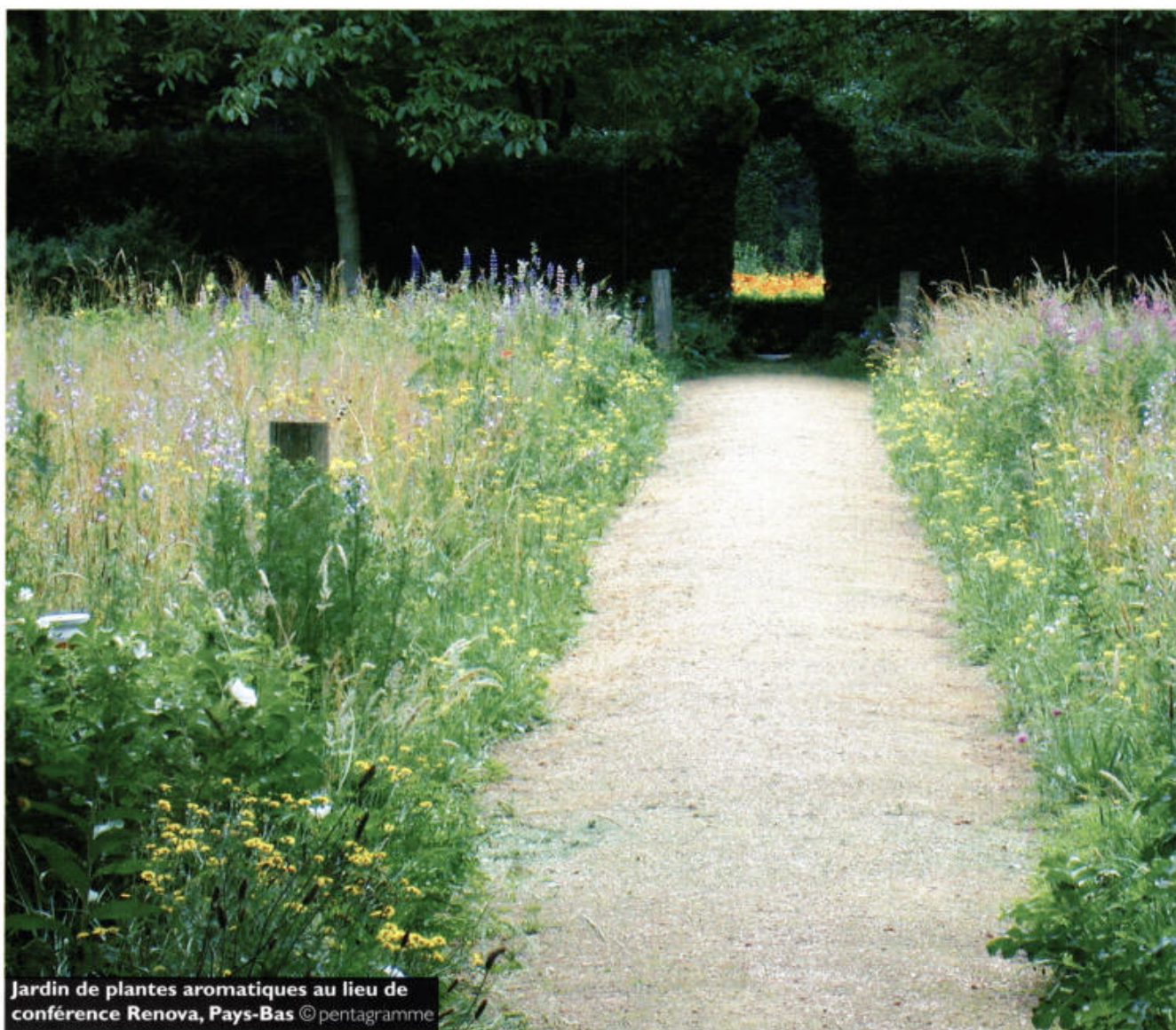
Jardin de plantes aromatiques au lieu de conférence Renova, Pays-Bas