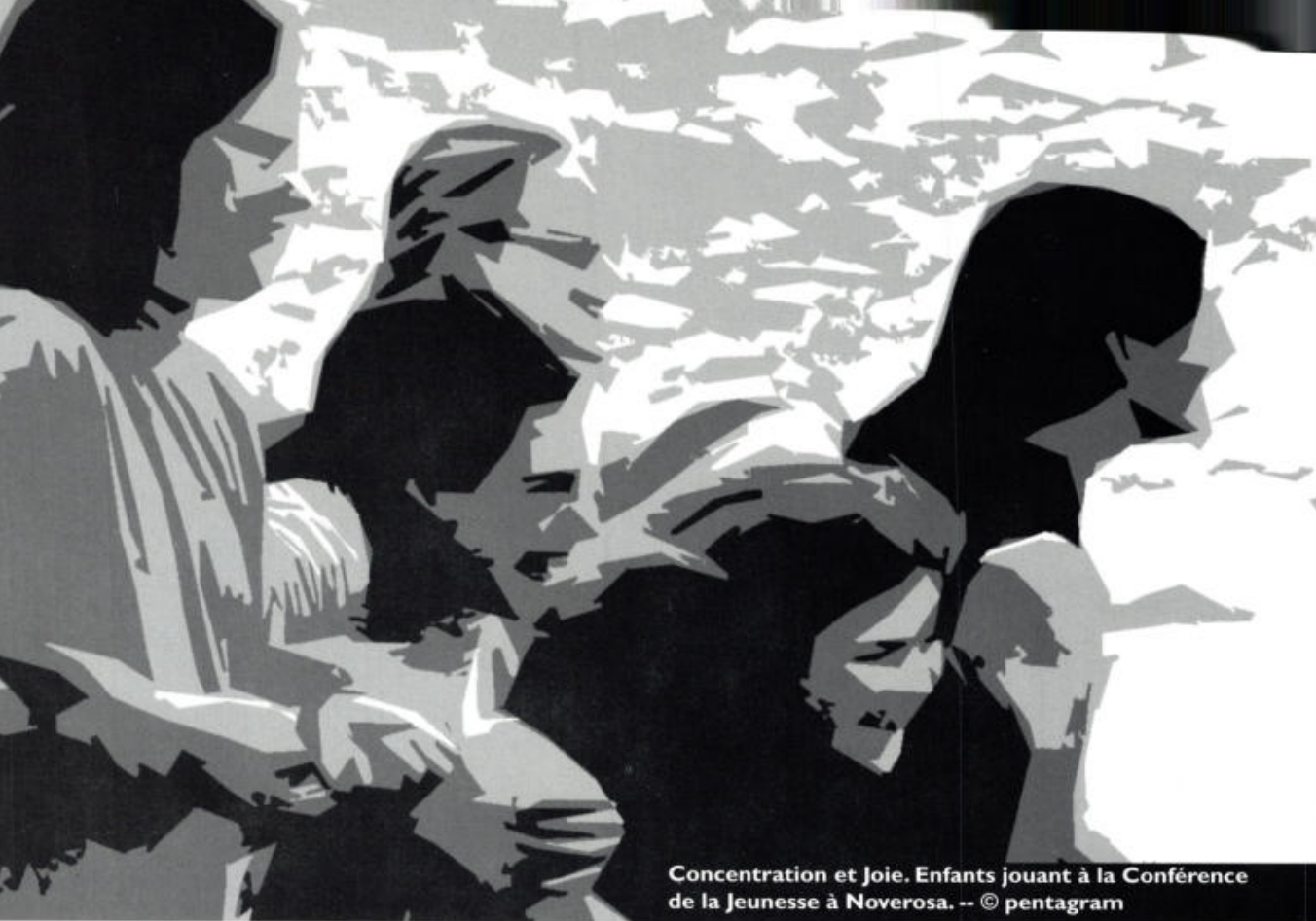
Concentration et Joie. Enfants jouant à la Conférence de la Jeunesse à Noverosa.

LA DEUXIÈME MOITIÉ DE LA VIE Les phases suivantes de sept ans chacune sont une répétition des sept premières, mais en sens inverse. Les premières ont trait, évidemment, à une croissance en relation avec l'extérieur, tandis que les dernières concernent la croissance intérieure. Dans l'Égypte antique, l'on pensait que le coeur, à côté de son action motrice, était le centre de la formation des pensées, que jusqu'à cinquante ans il prenait de la force et du volume, et qu'ensuite il se recroquevillait.