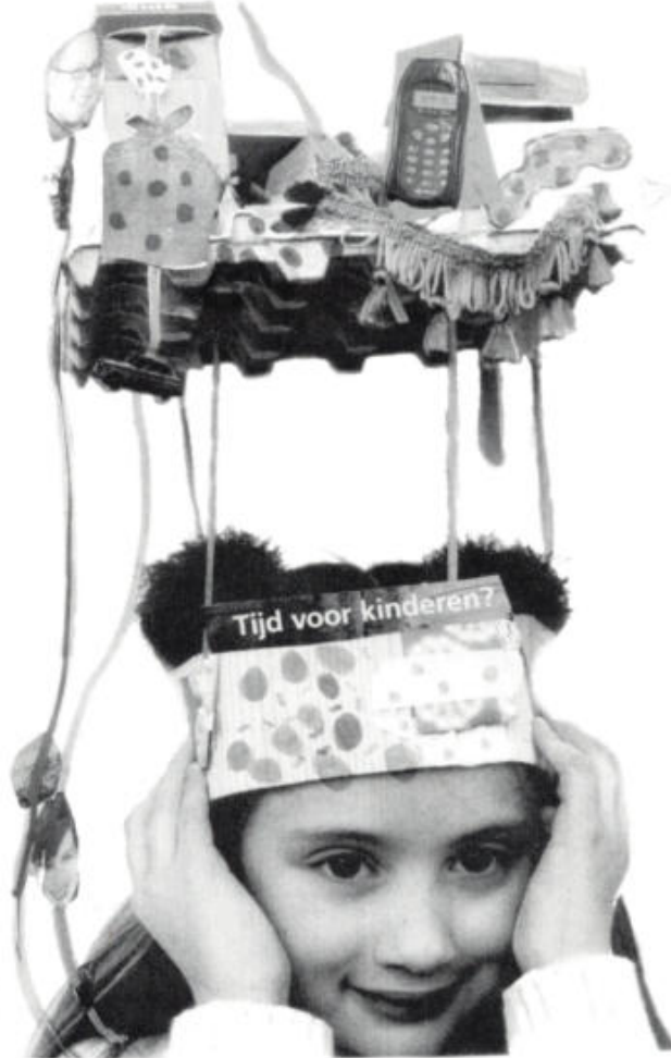
Un temps pour les enfants

de son moi, il peut parler des signes du zodiaque, du karma, du destin, de l'héritage sanguin influant sur sa famille, sur son peuple ou sa race; en effet tout cela joue un rôle. Le moi, dépendant de la sphère de vie qui l'entoure, garde pourtant le pouvoir de se donner une forme: