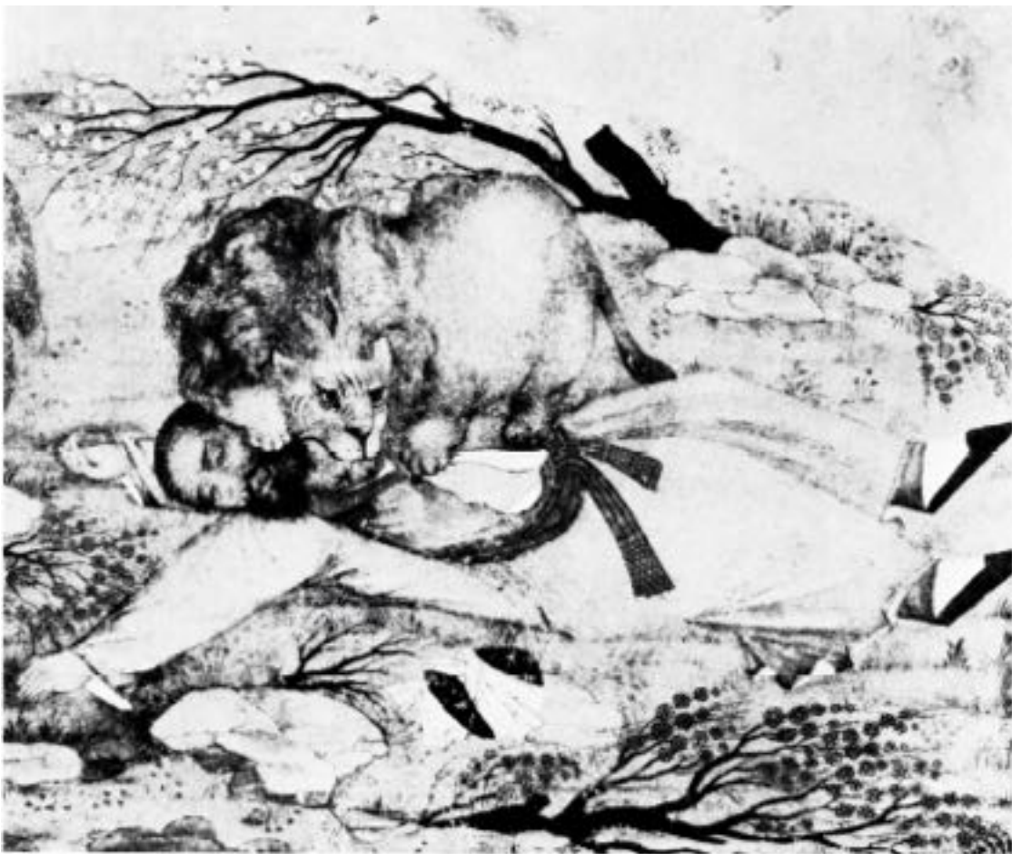
Le lion frappe. (Agha A. Zaman, Mongolie, environ 1600, sépia et couleurs).

Sans connaissance de l'âme, pas de liberté ! Sans connaissance de soi, nous pouvons nous retrouver à chaque instant dans une situation où l'âme nous pousse à des actes que nous ne comprenions pas et condamnions chez les autres peu de temps avant. Car le bien et le mal sont très proches l'un de l'autre. Celui qu'entraînent des influences de la nature et qui laisse son âme s'y noyer, n'est pas différent des innombrables êtres dont nous ne comprenons pas les actes et les condamnons.