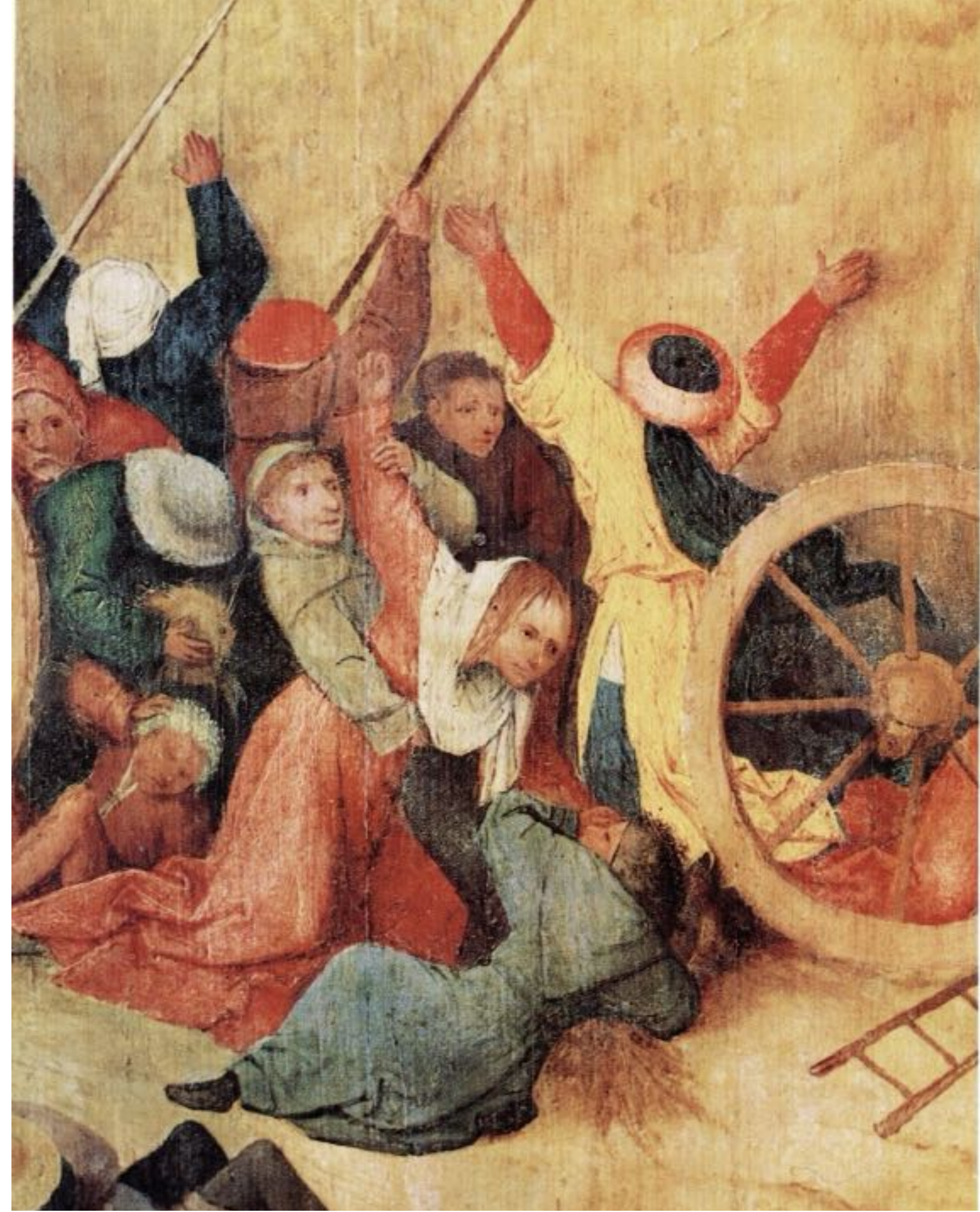
« Monter, briller, descendre » caractérise le rythme de la vie humaine. Le peintre Jérôme Bosch symbolise souvent cela par l'image de la roue.