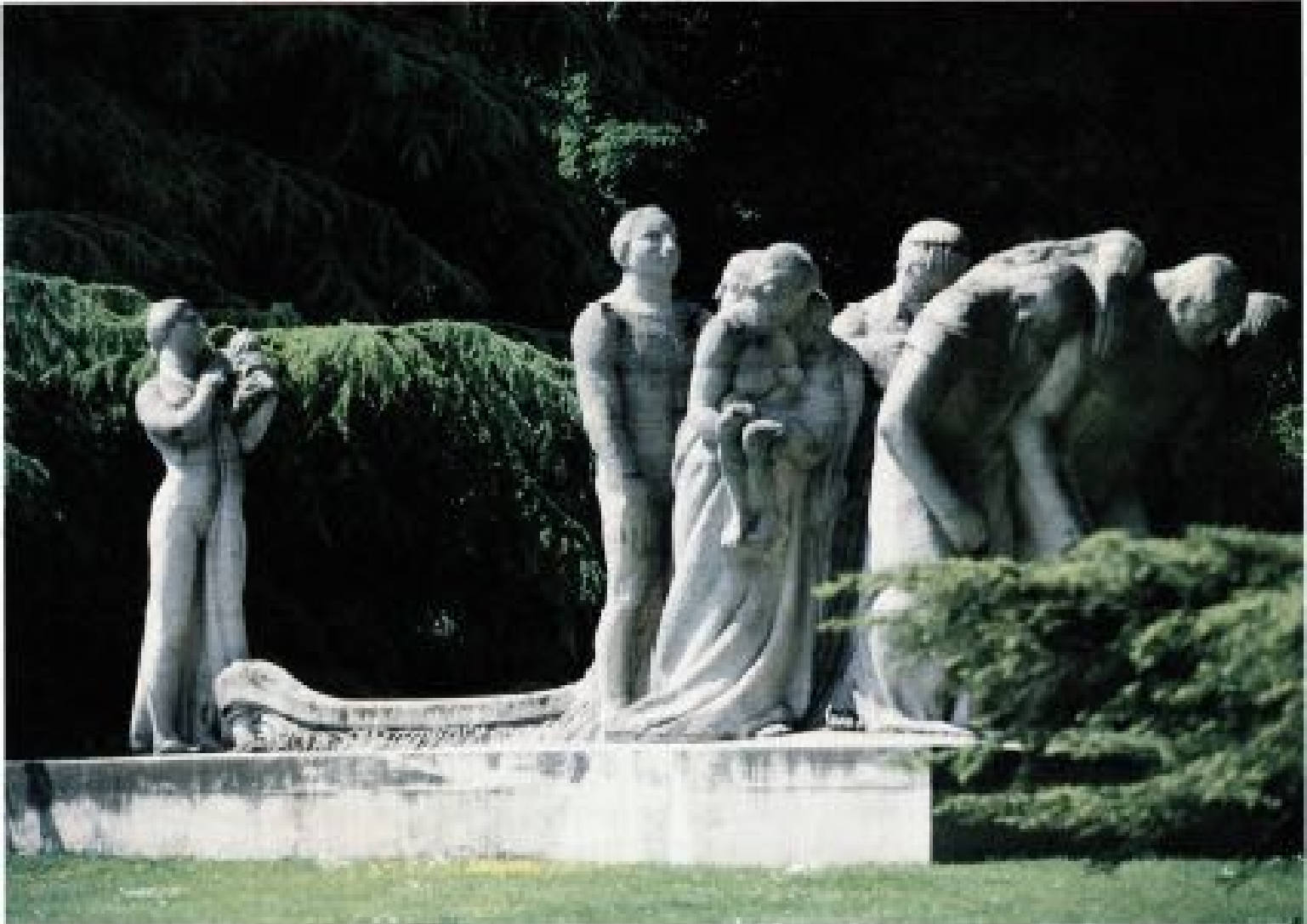
Le circuit fermé de l'existence humaine.

ceux qui suivent la voix de l'âme et reconnaissent la lumière de la vérité. Ils reconnaissent la Force christique comme la source de la vie véritable. Ils ont un chemin à parcourir, à travers trahison, opposition, mépris et mort. Tout au long de l'histoire de l'humanité, il y eut de nombreux travailleurs sublimes dans le vignoble de Dieu, qui se sont rangés dans l'ordre de la Lumière et ont suscité un grandiose réveil.