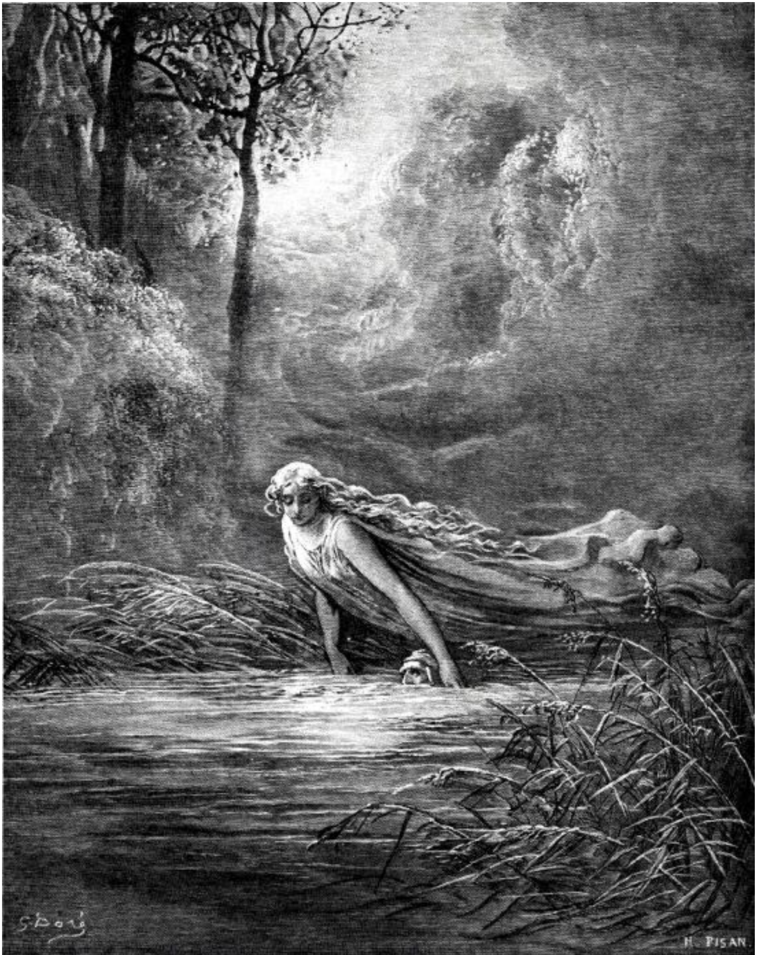
« La belle dame m'enserra la tête de ses deux mains et l'enfonça pour que j'absorbe l'eau ... » (Dante, le Purgatoire, chant 31, illustration de G. Doré)