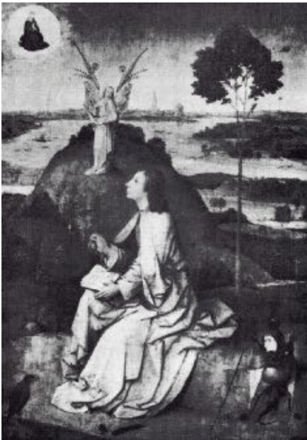
Jean à Patmos (Jérôme Bosch, 1504-05).

Au cours du développement de tout homme vers l'accomplissement de sa véritable destinée vient le moment où son âme atteint un calme parfait et où il s'oriente exclusivement vers l'Esprit. Le tableau de Jérôme Bosch intitulé Jean à Patmos dépeint cet état.