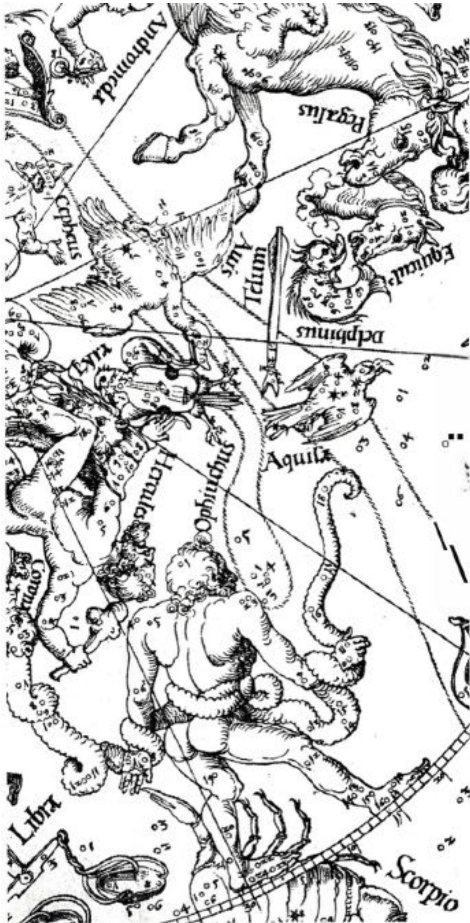
Le Cygne vole avec la Croix dans la direction d'Ophiuchus (Albert Dürer, 1515, National Gallery of Art, Washington D.C.)

saurait jamais vieillir. La description poétique du cygne d'or témoigne de cette connaissance profonde. Les symboles étaient utilisés pour faire une impression puissante et inoubliable sur l'imagination des êtres humains en évolution, lesquels vivaient encore très près de la nature. Qui veut se faire une idée de ces antiques peuplades, de la façon dont elles vivaient sous l'influence de la lumière, de l'air, de la nuit, de la vie et de la mort, peut en trouver encore des traces chez leurs derniers survivants. Dans une partie de leurs terres d'origine que les « hommes civilisés » daignent leur abandonner, ils mènent une existence difficile. Ils errent par petits groupes dans des zones désertiques en suivant toujours les mêmes modes de vie antiques, vivant littéralement avec les éléments et sous leur domination.