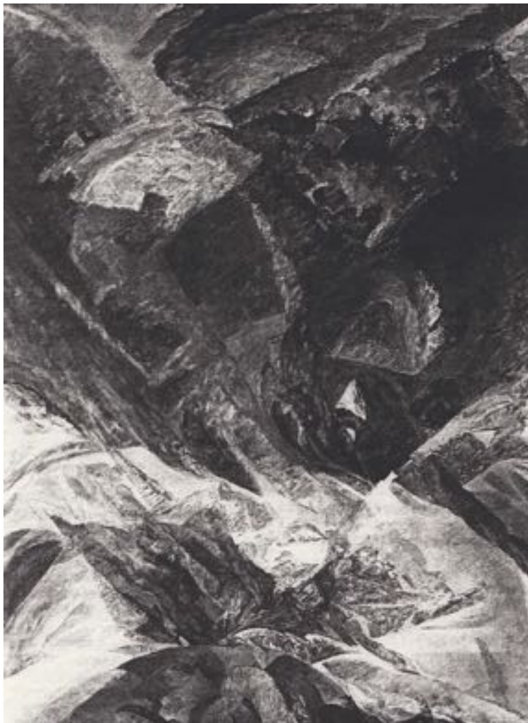
Acryl sur toile de E. De Keijser, Gand, Belgique

dans les mains de Dieu, si elle comprend le processus et désire l'accomplir. Sur le chemin du retour, il faut tout d'abord que se reforme le troisième noyau-âme et cela ne peut s'effectuer qu'à partir de la substance divine. Tentons d'esquisser à grands traits ce processus. Par suite de la différence fondamentale entre les clefs vibratoires de toutes les formes et forces de la nature dialectique et celles du champ de vie divin -différence qui rend impossible la liaison directe du système humain doté de l'atome-étincelle d'esprit avec la Gnose, c'est-à-dire le rayonnement issu du champ de vie divin — la Fraternité Universelle créa un champ de rayonnement de vibration inférieure, sorte de pont entre les deux champs de vie. Au moyen d'un processus de transmutation, la Gnose a ainsi la possibilité d'établir une liaison avec l'atome-étincelle d'esprit de l'homme.