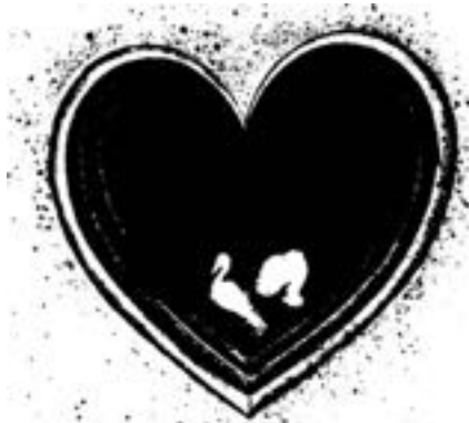
Illustration 29 de la série « Etats émotionnels du cœur », A. Bast, Hohenstadt ( Allemagne de l'ouest)

La lentille toutefois ne reçoit, ne perçoit la lumière que s'il y a une pupille, une ouverture, un vide. Le mot pupille est dérivé du mot latin « pupilla », qui signifie : petit homme, homme mineur, celui qui a besoin d'une direction, qui doit encore apprendre. Pensez aussi au mot anglais pupil qui en est dérivé et veut dire « élève ». Par la pupille de l'œil se reflète la petite image de l'homme, l'homme y est très petit. On pourrait dire que, dans la pupille, par cette ouverture, par ce vide, l'homme est ramené à de très petites proportions. « Je dois diminuer, je dois décroître ; et Lui, l'Autre en moi, doit croître. La nouvelle vision, l'œil divin, l'autre homme en moi, doit grandir. »