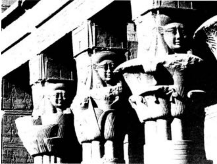
Colonnes du Temple d'Isis à Philae (Égypte)

Celui qui ose faire l'offrande de soi-même, caractéristique de l'ère des Poissons, ne craint rien et n'a plus peur. Nous observons souvent, autour de nous, une apathie générale, un appauvrissement des sentiments, un manque d'amour pour les créatures. L'homme se cuirasse pour ne pas couler à pic dans l'immense souffrance du monde, laquelle lui parvient, en particulier, par les media. Or le cœur endurci est aussi imperméable aux impulsions gnostiques !