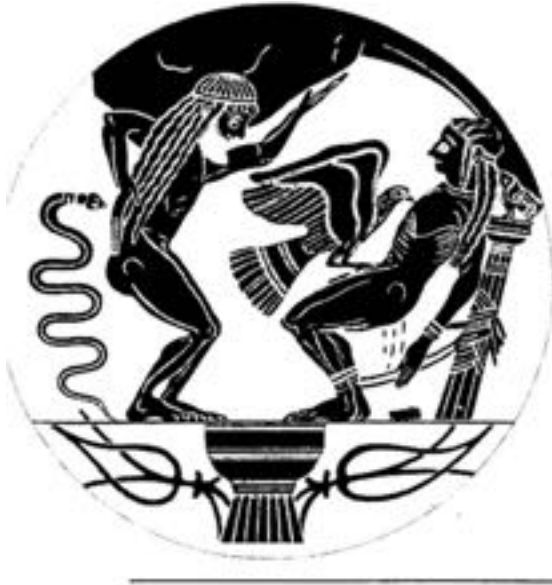
Grèce antique : Représentation de Prométhée enchaîné.

Déjà la terre est devenue trop petite pour l'homme qui ne cesse de créer dans sa folie des grandeurs. De son cerveau surchauffé a surgi l'idée de manipuler les gènes et d'autres bestialités. On dirait que l'homme déchaîné s'est préparé pour le saut ultime : se prouver à lui-même sa propre puissance ; et sa colère monte jusqu'au ciel comme une colonne de fumée.