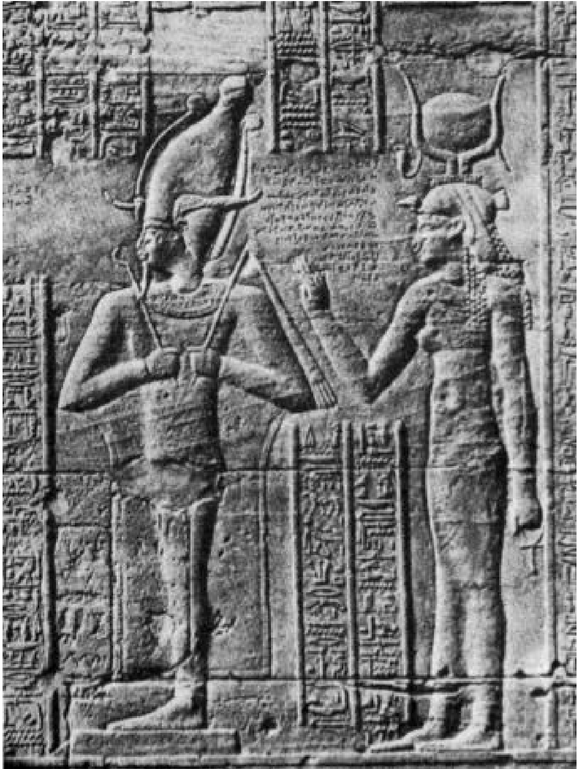
Osiris et Isis