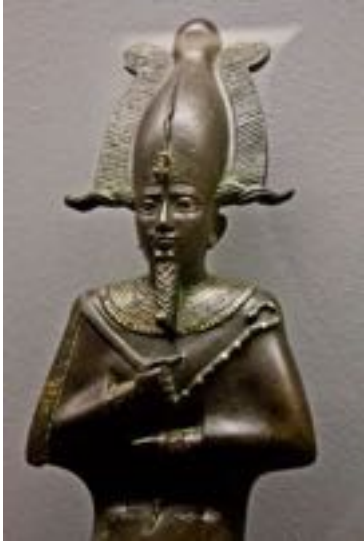
Osiris, symbolisant l'aspect spirituel des mystères égyptiens d'Isis, Osiris et Horus, source et interprétation des écrits d'Hermès Trismégistes.