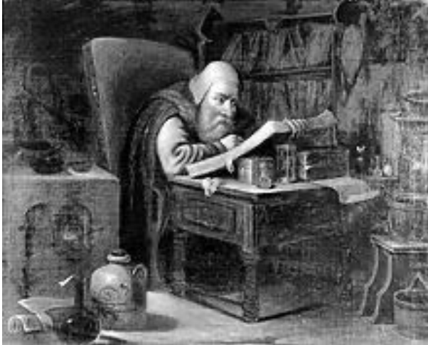
Jakob Boëhme dans son atelier de cordonnier travaillant à ses écrits.

divine. L'homme prisonnier peut se diriger dans cette direction, car la plénitude des rayonnements de la nature originelle non seulement entoure son champ d'existence mais le pénètre.