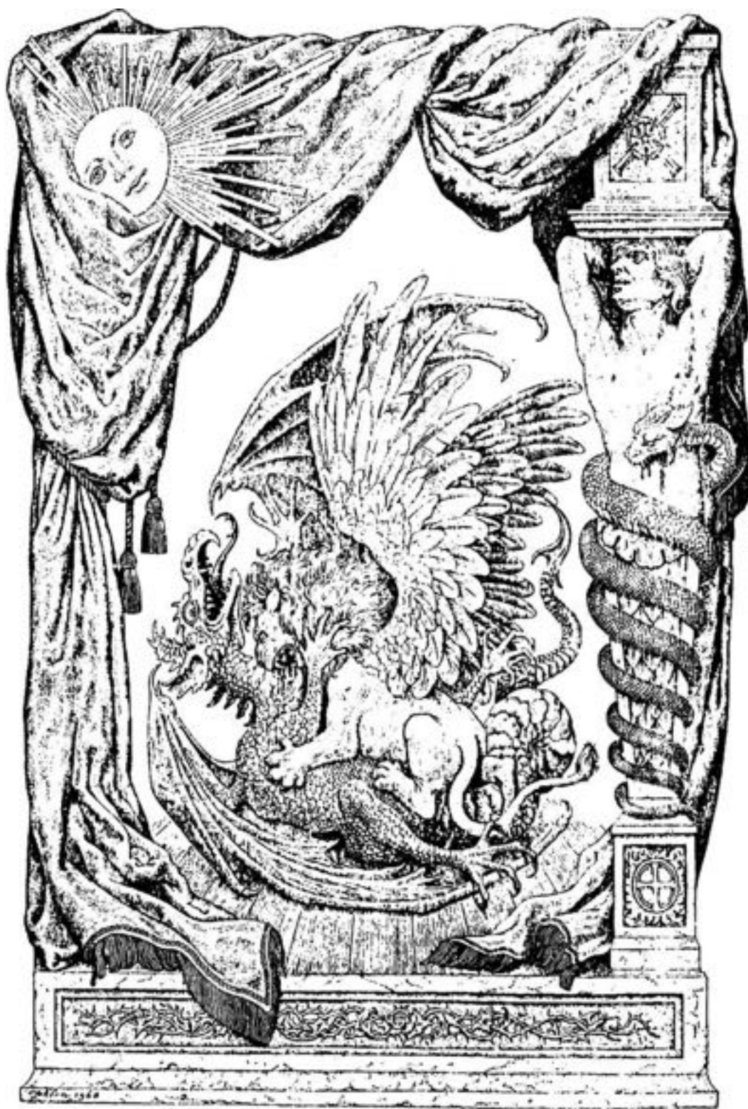
Les animaux des mystères

l'action des sept rayons. Il est sans cesse sur la balance : en effet, équilibrer les poids constitue un processus.