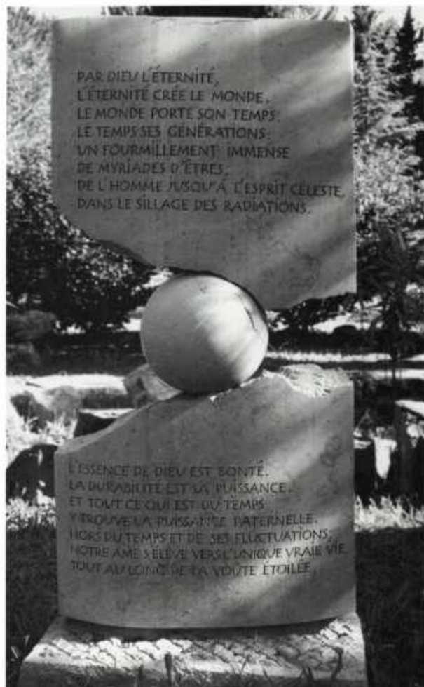
Sculpture de Bernard Pécout au centre de conférence de La Licorne, Gignac, France.

Celui qui s'exprime ainsi, de manière simple et vraie, ne tombera pas dans le piège de croire que sa forme naturelle deviendra un jour parfaite. Il comprend le mésusage de l'intelligence de ceux qui, nombreux, veulent toujours