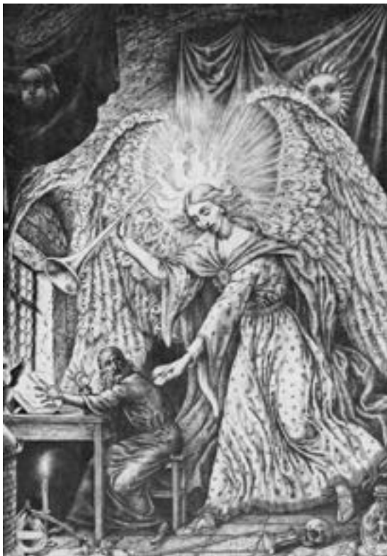
Le soir avant Pâques

Il est donc clair que le monde entier est touché et doit être touché par cette Lumière. Si ce n'est pas au sens positif, secourable, c'est comme par une force négative, un feu dévorant. La Lumière nous est une résurrection ou une chute, ce qui signifie dans le dernier cas, un long et amer chemin d'expériences. D'un lointain passé, un récit nous est transmis, que nous pouvons imaginer comme se situant sur le Mont Olympe où trois dieux se rassemblent. Ces dieux discutent de la manière à utiliser pour tenir secret, un mystère, aux hommes. Il s'agissait de cacher un joyau merveilleux. Ce joyau contenait l'éternité.