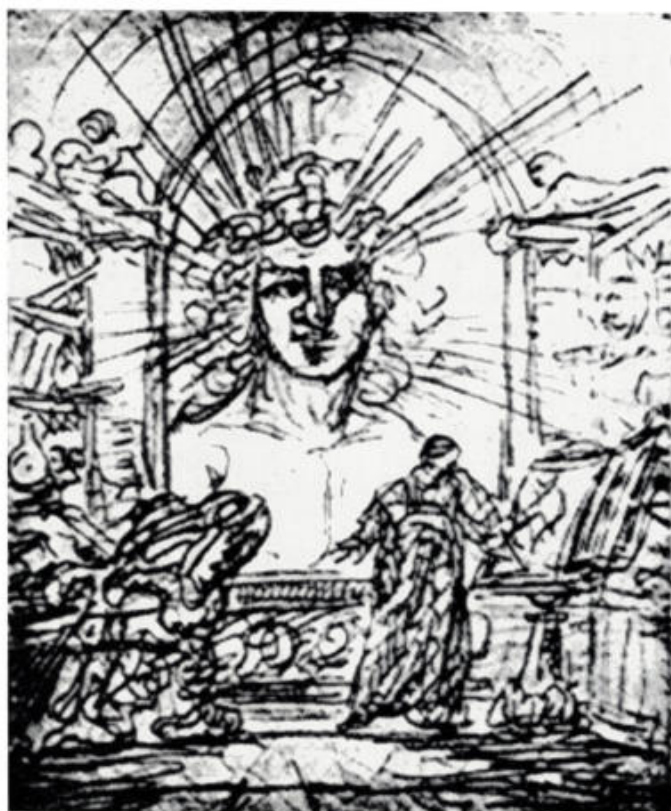
« Qui m'appelle ? » L'Esprit de la Terre apparaît devant Faust (dessin de Goethe vers 1810).

de personnages des mythes antiques en cette nuit « classique » de Walpurgis. Méphistophélès et Homunculus y transportent donc Faust par les airs. Ce dernier, en effet, se réveille et dit : « Où est-elle ? » Grâce au Sphinx, au centaure Chiron et à la sybille Manto, il se rend dans l'Hadès pour chercher Hélène. Méphistophélès a du mal à le suivre, et après avoir rencontré des sphinx, des lamies et d'autres personnages fantomatiques, il se cache sous la forme d'une des trois Phorkyades pour poursuivre sa route sans encombres sous le nom de Phorkyas.