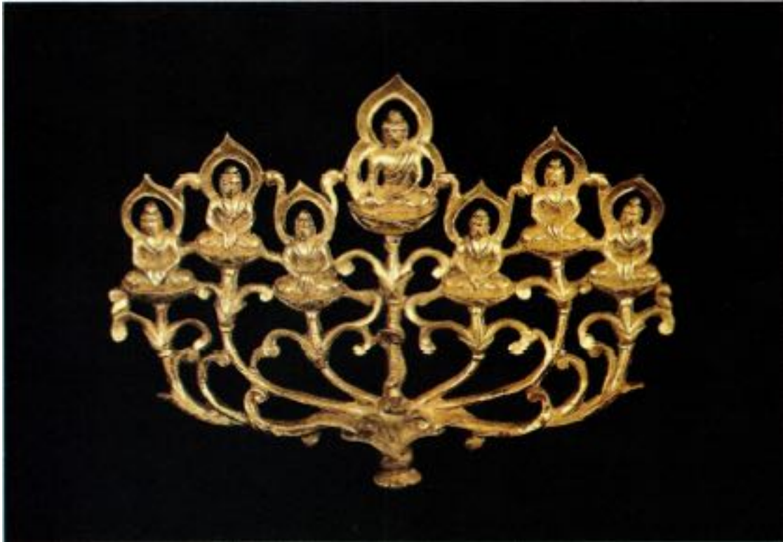
Les sept Bouddhas (Statue de bronze doré, Chine, 1ère moitié du Xème siècle)

ses élèves : « Écoutez, il existe quelque chose qui n'est pas né, quelque chose qui n'évolue pas, quelque chose de non-crée et de non-formé; si ce non-formé, cet incréé, ce non-né n'existait pas, il n'y aurait pas de porte de sortie hors de ce monde né, créé, formé. »