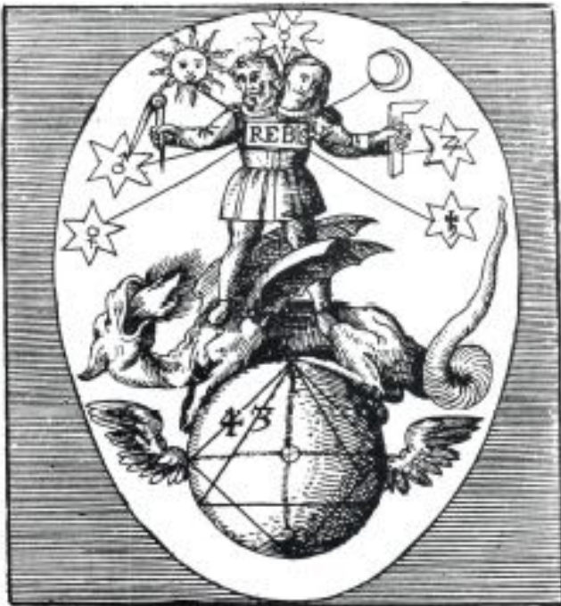
Représentation de l'être bisexué (tiré de J.H. Jamsthaler, Viatorium Spagyricum, Francfort, 1625)

« L'amour est patient, il est plein de bonté ; il n'est pas envieux, il ne se vante point, il ne s'enfle point d'orgueil, il ne fait rien de malhonnête, il ne cherche pas son intérêt, il ne s'irrite point, ne soupçonne pas le mal, ne se réjouit pas de l'injustice, mais il se réjouit de la vérité ; il excuse tout, il croit tout, il espère tout, il supporte tout. Les prophéties prendront fin, les langues cesseront, la connaissance disparaîtra, mais l'Amour ne périra jamais. »