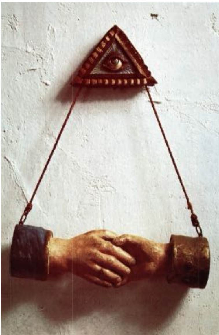
Photo à droit : Les mains enlacées sont depuis des siècles le symbole du mariage le plus apprécié de l'art populaire. Le symbole de l'union de deux vies était alors accompagné de sentences, ou, comme ici, placé sous l'œil ouvert de Dieu.

Une source, un courant d'amour divin porte tous les êtres et leur donne la possibilité de réaliser leur propre développement intérieur ; celui-ci, compris dans la matrice spirituelle, s'effectue dans le microcosme grâce à l'atome-étincelle d'esprit. L'Esprit Septuple agit dans ce courant de sorte que le fleuve d'amour qui porte tout et tous transmet en même temps la force de la sagesse — la force en tant que vérité et la connaissance de la volonté divine — jusqu'à la réalisation parfaite de l'intention divine.