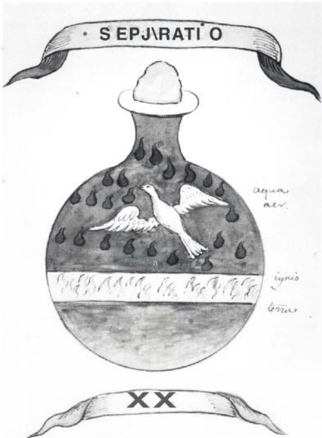
La colombe s'élève hors des quatre éléments, le feu, l'air, l'eau et la terre, symbole de la libération de l'esprit (tiré de M. Majer, Scrutinium Chymicum , Francfort, 1787.)

général que le mariage terrestre se fonde sur l'amour, et que son but serait d'entretenir la famille, de perpétuer la génération, le peuple, la race. Mais celui qui s'interroge quelque peu sur le mariage de façon consciente ne se contente pas de ces notions dialectiques limitées. D'un point de vue supérieur, le mariage est plus qu'une manifestation d'amour. C'est une alliance par laquelle le Créateur ouvre le chemin de l'éternité. Sans dimension spirituelle, l'homme stagne dans la phase sous-humaine, et le mariage n'a qu'un but limité.