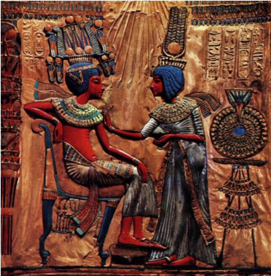
Statue de l'Égypte ancienne (environ 1350 ans avant J-C)

dangereuse que de se suggérer cet état à soi-même, intellectuellement ou mystiquement. Quand vous parviendrez à cette étape de votre développement, les choses seront si évidentes que toute erreur sera exclue.