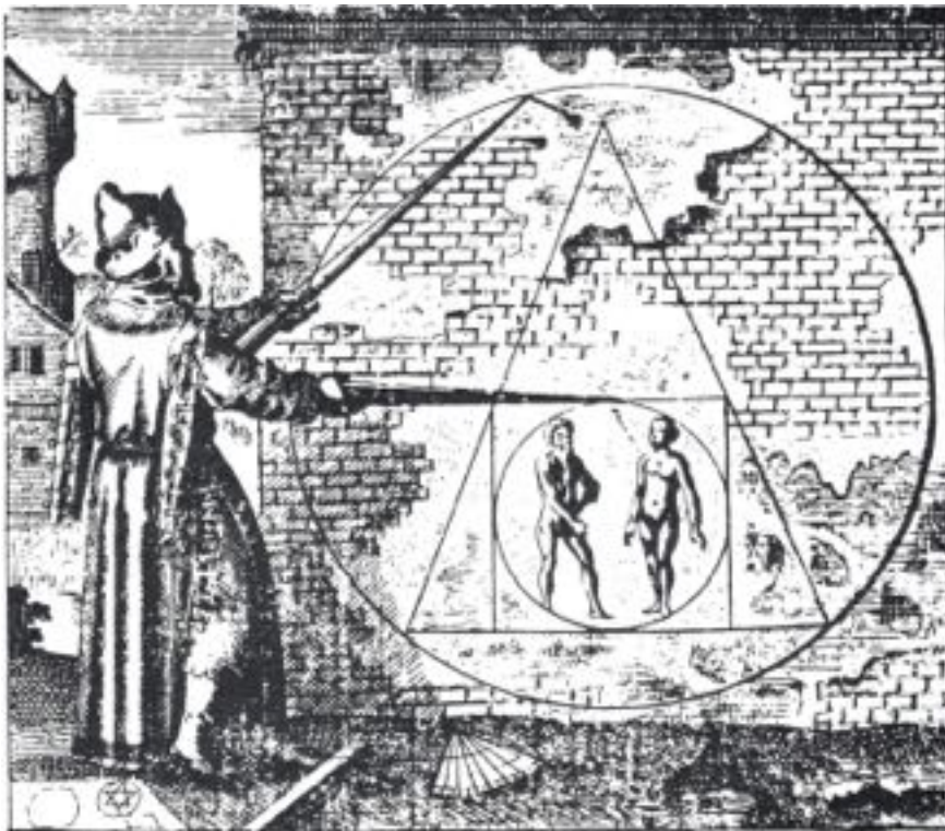
La quadrature du cercle, les deux sexes réunis en un.

Quand l'homme et la femme sont enflammés dans la volonté divine, leurs microcosmes respectifs masculin-féminin ne font plus qu'un. Joseph et Marie collaborent dans chaque microcosme, célèbrent les noces alchimiques, et la personnalité immortelle se développe. Comme à l'origine, la tête redevient le pôle positif de l'âme-esprit et possède la clef de la Manifestation Universelle pour transmettre la volonté divine. Le cœur, le pôle négatif de l'âme-esprit de jadis, redevient le porteur et le gardien du feu divin, dans l'amour et la sagesse du Fils. La tête et le cœur forment alors un chantier alchimique purifié, au service de la Gnose. Une collaboration harmonieuse est à nouveau possible entre les deux aspects du microcosme ; collaboration en accord avec la double unité cosmique originelle de la vague de vie humaine.